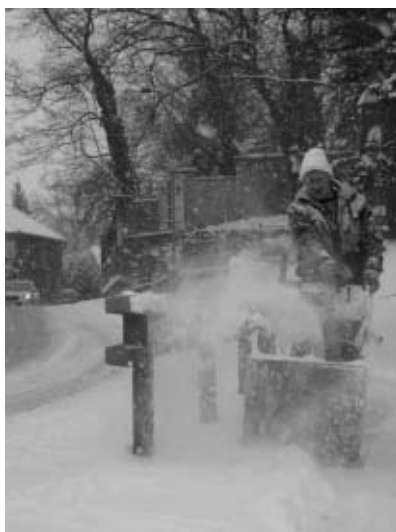
Poslední záchrva zimy Odklizení sněhu 6. března

• Ještě o prvním březnovém víkendu se dostala ke slovu zima. V Jirnech napadlo asi 10 cm sněhu a obec se znovu dala do uklízení. Dlouho nás však sněhová pokrývka netrápila a druhá polovina března byla naopak ve znamení nadprůměrně vysokých teplot.