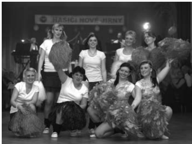
Vystoupení taneční skupiny „Poupata“

Návštěvnost občanů byla obrovská a kulturní dům praskal ve švech. Všichni se určitě příjemně pobavili