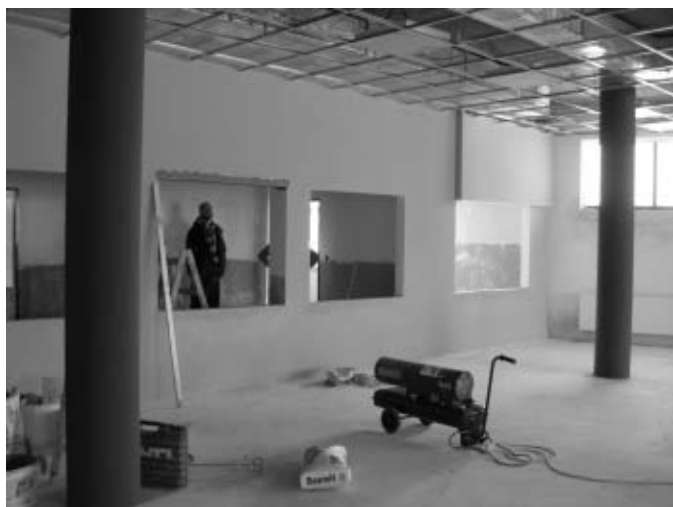
Jidelna v pohledu s výdejními okny

K polovině února, kdy jsou připravovány podklady k tomuto článku, je možné konstatovat: po naštukování vnitřních omítek byla provedena základní podmalba, byly natřeny zárubně dveří. Dále byly dokončeny rozvody ústředního topení včetně kompletního vystrojení centrální plynové kotelny i s ohřevem teplé vody, kotelna byla uvedena do zkušební provozu. Je dokončována montáž rastrů pro budoucí podhledy s osvětlením. Ve značné fázi rozpracovanosti jsou i obkladačské práce a pokládka dlažby, po níž bude následně v prostorách