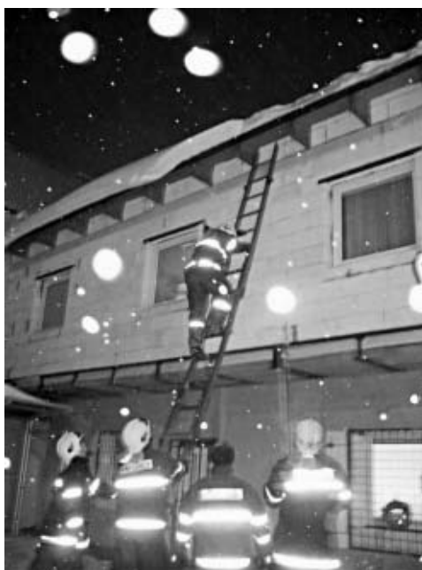
Odstraňování sněhových převisů ze střechy