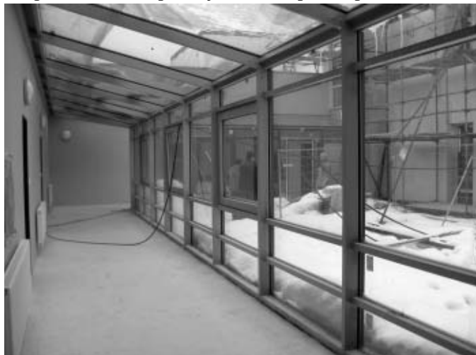
Prosklená spojovací chodba v přízemí budovy

Ačkoliv většině z nás dává letošní zima pěkně zabrat a venku kolem objektu MŠ vše působí spícím dojmem, ve vnitřních prostorách nové budovy je tomu právě naopak a stavební práce jsou zde v plném proudu.