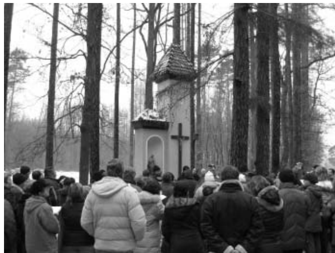
Kaplička se dostalo pozornosti mnoha lidí

šly celé rodiny, známí a přátelé z Jiren, Nových Jiren, Šestajovic i Nehvizd, aby si společně zazpívali, popřáli hezké svátky a naladili se do štědrovečerní atmosféry.