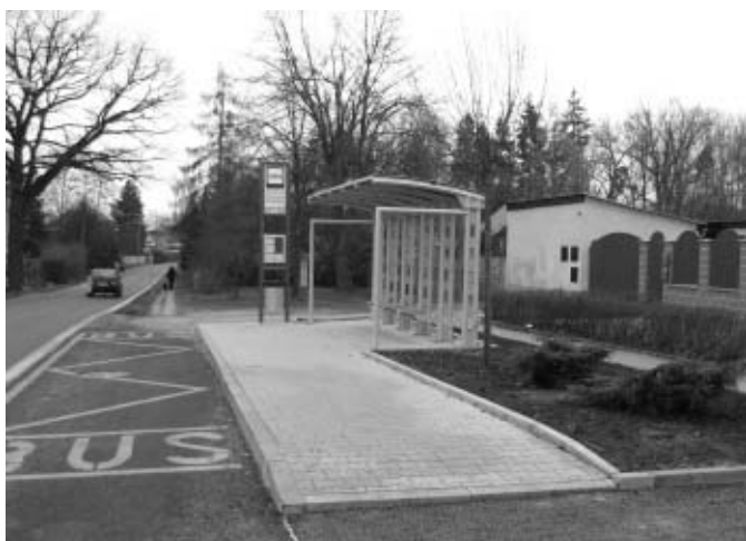
Autobusové zastávky Jirny, Nové Jirny II.

V průběhu prosince se rýsovala konečná realizace dalšího projektu, a to modernizace autobusových zastávek