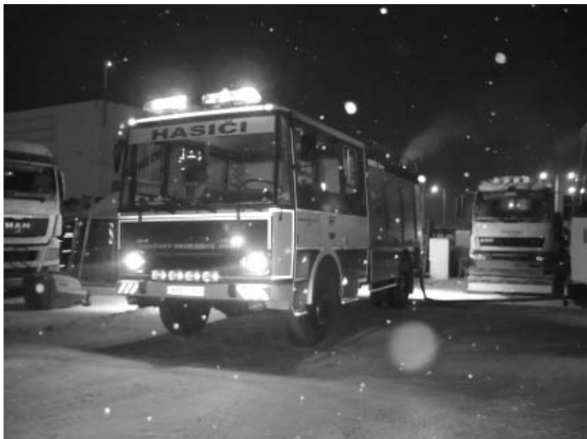
Fotografie z výjezdu k požáru obytné buňky v Jirnech

Naším doposud posledním výjezdem se stal požár obytné buňky v Jirnech dne 18. 12. 2009. Ve večerních hodinách jsme obdrželi poplašnou zprávu o požáru nízké budovy. Po příjezdu na místo jsme rozvinuli útočné vysokotlaké vedení a zahájili jsme hašení požáru. K uhašení požáru bylo nezbytné rozebrání dřevěných palubek, které nám zamezovaly přístup k ohnisku požáru. Největším nebezpečím byly zaparkované nákladní automobily, u kterých hrozilo přeskočení požáru. Naštěstí požár nebyl na tolik rozsáhlý, aby k tomu došlo. Největším problémem však byl velký mráz, který po celou dobu zásahu sužoval nejen nás, ale i techniku. Celý zásah trval něco málo přes hodinu.