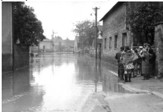
Družstevní ulice po průtrži mračen v roce 1972.

Vážená redakce, způsob, jakým jste začali v Jirenském zpravodaji psát o událostech v obci, má ten správný „šmrnc“. Občané jsou tak podrobně informováni o tom, co se v Jirnech dě-