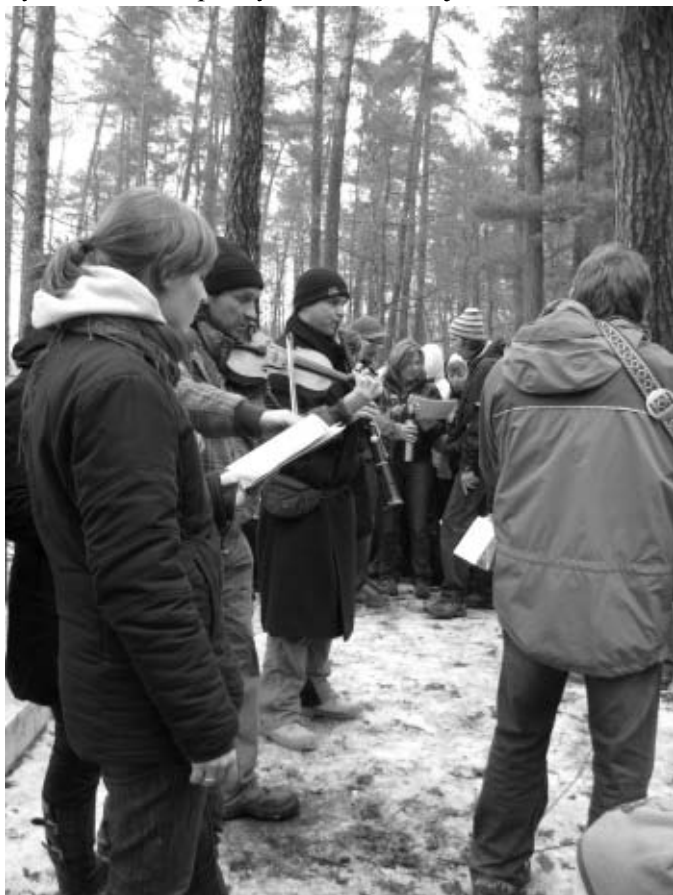
Muzikanti před kapličkou

Pomalou tající, již dávno ne bílý sníh křupe pod kroky chvátajících opozdílů. Jsou dvě hodiny odpoledne 24. prosince a v Nových Jirnech zaznívají lesem první tóny houslí. U kapličky se zde konal již tradiční koncert