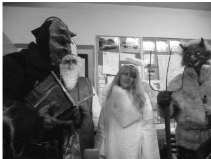
I u hasičů najdete Mikuláše, čerty a anděle v uplynulých letech.

V roce 2009 jsme nezapomněli ani na naše nejmenší spoluobčany a dne 20. 6. jsme pro ně přichystali Hasičský den, kde jsme předvedli naši techniku a děti mohly na vlastní oči spatřit hašení požáru osobního automobilu. Další zpestřením pro děti byl skákací hrad a diskotéka. Na svátek sv. Mikuláše jsme také nezaháleli a připravili pro naše děti Mikulášskou besídku, které se zúčastnili i sv. Mikuláš, čerti a anděl. Všechny děti měly být celý rok velice hodné, protože nikoho z nich si čerti neodnesli do pekla a laskavý anděl je odměnil sladkostmi. Podobné akce chystáme i v letošním roce a doufáme, že účast bude minimálně tak velká, jako