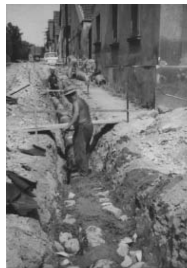
Brigáda na stavbě povrchové kanalizace v ulici 5. května v roce 1973

Věřím, že jakmile to finance dovolí, dočkáme se i těch lepších chodníků a zpevněných povrchů bočních ulic. Na závěr bych chtěl říci, že Jirny a jejich okolí je krásné, žiji zde 73 let a nikdy bych neměnil.