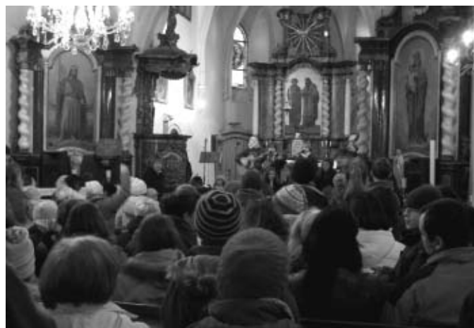
Ztracená kapela v jirenském kostele

Pátého prosince uspořádalo v jirenském farním kostele sv. Petra a Pavla občanské sdružení Občané obcí Jirny a Nové Jirny Setkání se svatým Mikulášem. Cílem akce