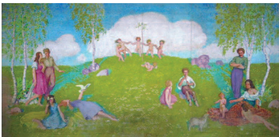
Opona po rekonstrukci

a vaše děti opět těšit v sále Kvapík. A mezitím jsme pro vás připravili pár vzpomínek z historie jirenských ochotníků.