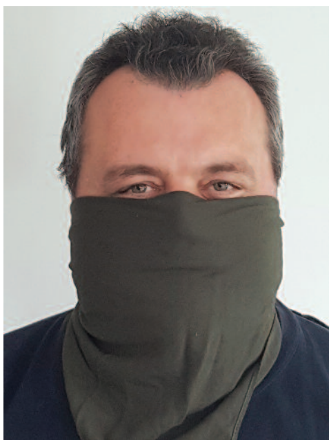
Fotka představujícího se ochotníka s improvizovaným povinným zakrytím dýchacích cest v době vyhlášeného nouzového stavu - nejedná se o ilustrační foto.